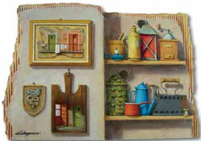
Elio Borgonovo - Miscmasc de regòrd Òli sora carton tratta - 30x21 cm