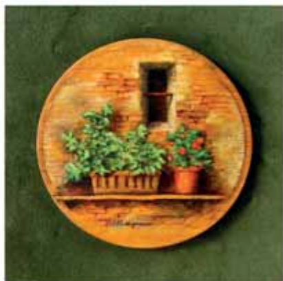
Elio Borgonovo - Fior, finestroeu e velù Òli sora on coverc de legn d'on quaicòss - 13,5 cm Ø