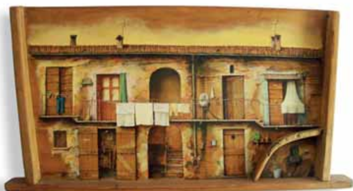
Elio Borgonovo - Ringhera - Òli sora assa di pagin - 84x46x7 cm