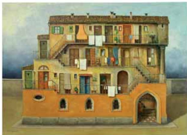
Elio Borghonovo - Ma la sarà globalizzazione? - Òli sora tela - 70x50 cm