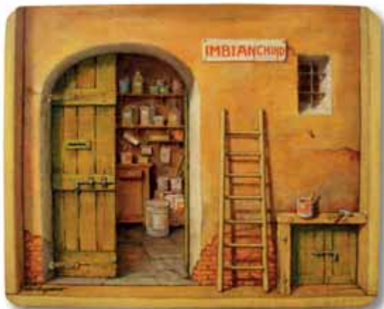
Elio Borgonovo - La bottega del sbianchin - Òli sora assetta - 29x23 cm