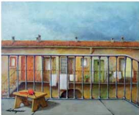
Elio Borghonovo - Mèj preparà che l'è giamò 'dree rivaa Oli sora assetta de legn - 25x20 cm