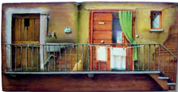
Elio Borgonovo - El tifos de l'ultim pian Oli sora assetta de legn - 39x20 cm