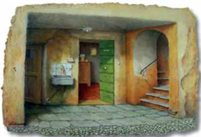
Elio Borgonovo - Triti sit - Oli sora carton tratta - 36x25 cm