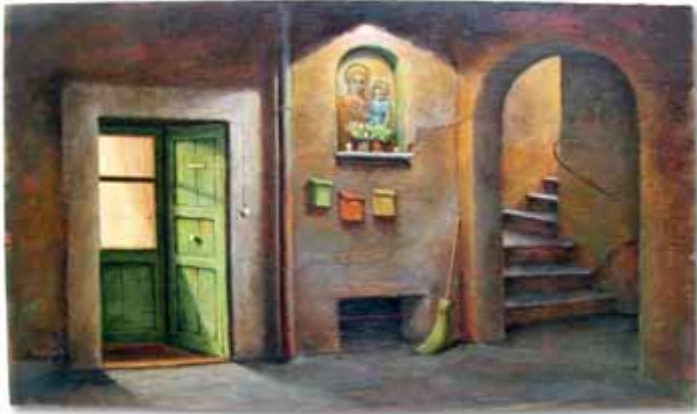
Elio Borghonovo - I lus de la cart - Ôli sora assetta de legn - 35x20 cm