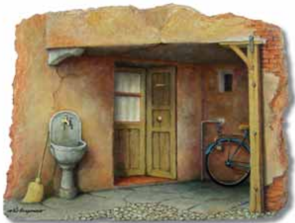
Elio Borgonovo - Mèj ligalla anca a mezzdi Oli sora carton trattaa - 30x22,5 cm